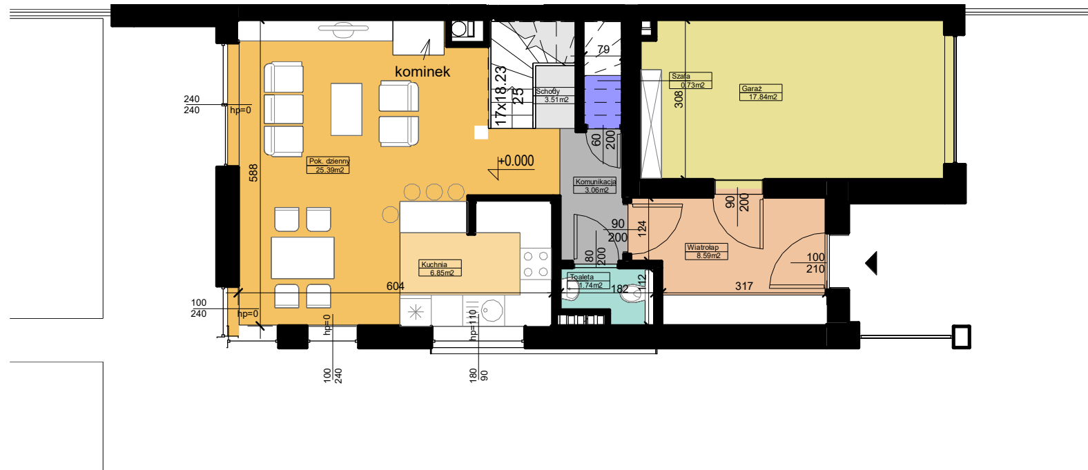
Plan mieszkania M4 - parter skala 1:100