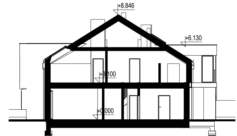
Przekrój skala 1:200